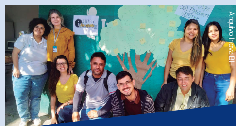
No DSSGI (Diálogo Semanal de Sistema de Gestão Integrado) a equipe da Saúde do Trabalho, junto com a equipe de Comunicação, fez a Árvore da Vida. Um espaço para deixar recados e mensagens positivas