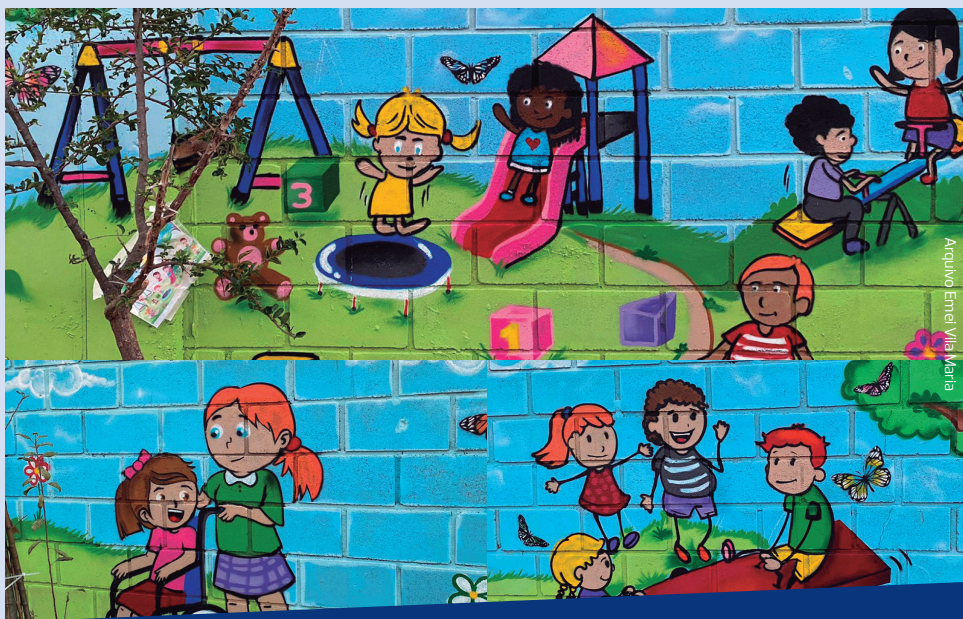
A pintura pedagógica, feita pela Direção da Emei Vila Maria, trouxe diversidade e integração nas artes