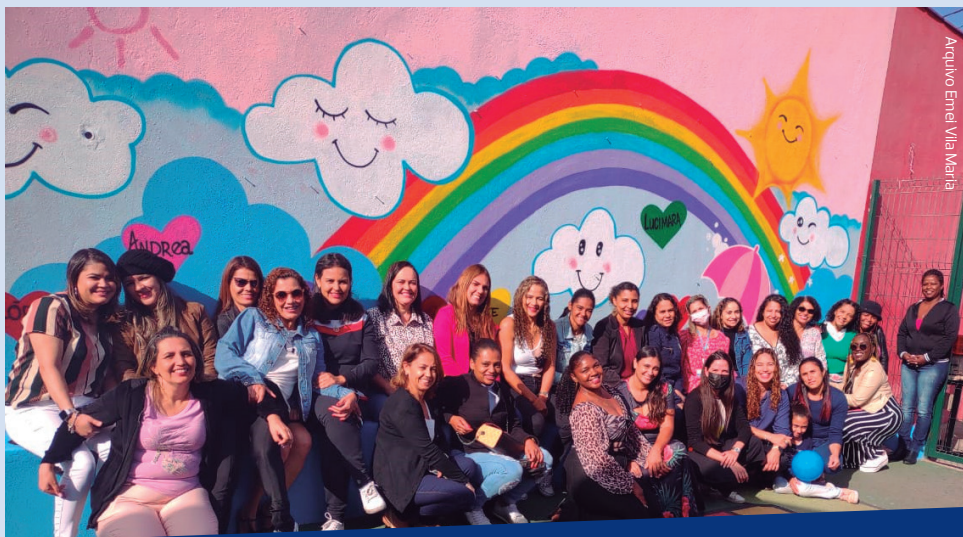
Toda equipe que trabalha na Emei Vila Maria teve seu nome pintado no muro da escola. O excelente trabalho feito com as crianças só pode ser alcançado com a união de todos

Confira nas fotos ao lado como ficou a horta e a fachada da Emei Vila Maria.