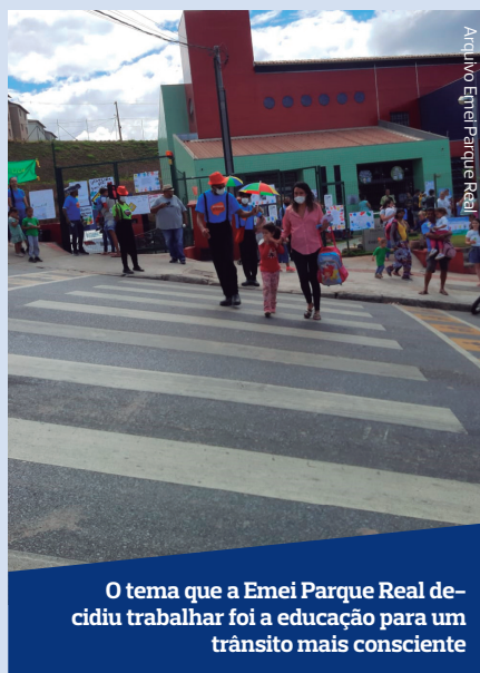
O tema que a Emei Parque Real decidiu trabalhar foi a educação para um trânsito mais consciente