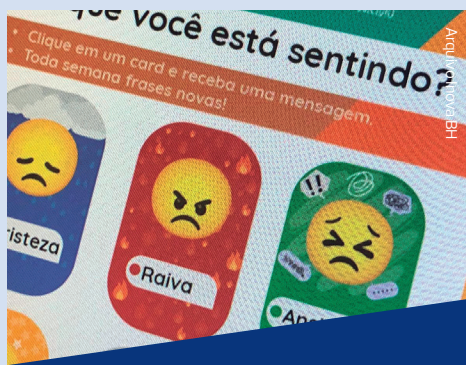
Semanalmente, a equipe de Comunicação enviou um Cartaz dos Sentimentos para o e-mail dos colaboradores. Ao clicar em um sentimento, uma mensagem de ajuda surgia na tela