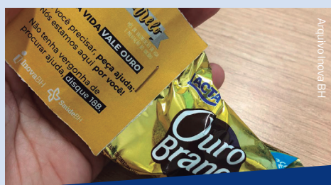
Também foram distribuídos brindes com a temática "Sua vida vale Ouro" para todos os colaboradores