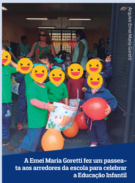
A Emei Maria Goretti fez um passeio aos arredores da escola para celebrar a Educação Infantil