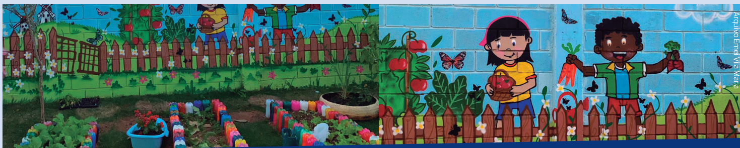
A construção da horta contou com o apoio da equipe de Jardinagem e do Carpinteiro da Inova BH