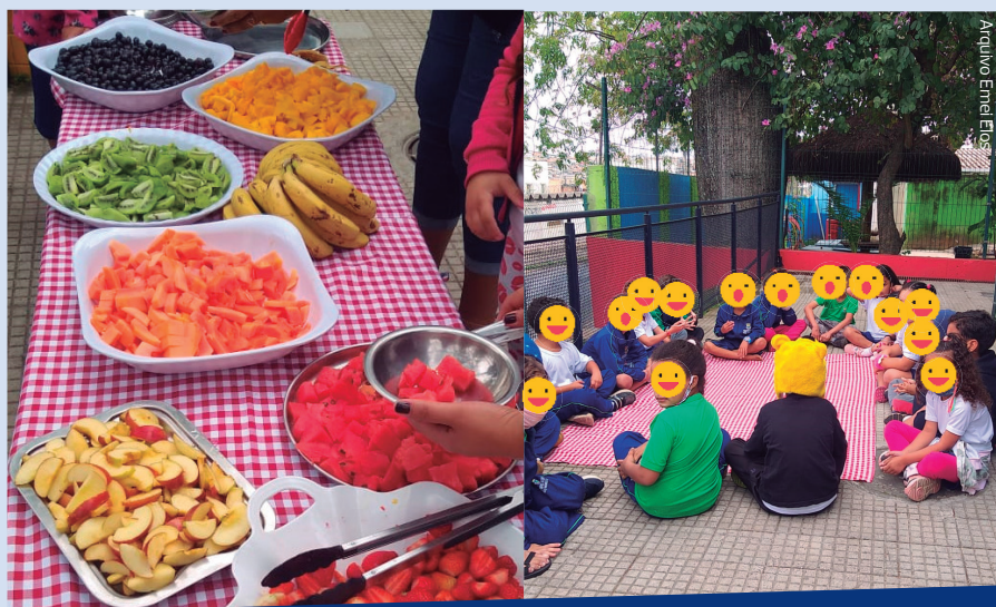
Na Emei Elos aconteceu um picnic com diversas frutas para as crianças experimentarem