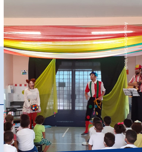
A peça de teatro apresentada trouxe várias cantigas de roda para as crianças da Emei Serra Verde

Para ver mais fotos e acompanhar notícias da Emei Serra Verde, acompanhe a página do Facebook da escola: https://www.facebook.com/emeiserraverde .