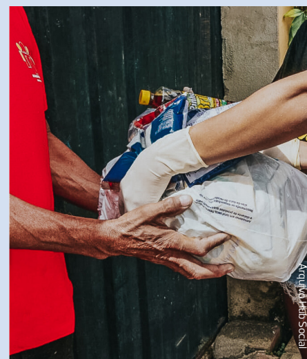
As doações ajudaram mais de 140 projetos sociais