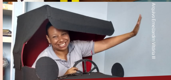
Arquivo Emei Jardim Vitória III

Alguns registros das Mostras Culturais que aconteceram nas escolas da Parceria