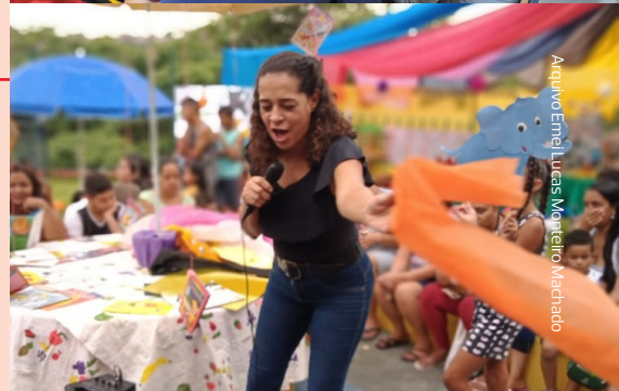
Arquivo Emei Lucas Monteiro Machado