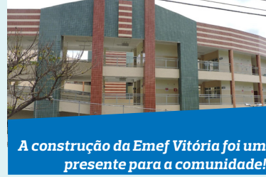
A construção da Emef Vitória foi um presente para a comunidade!