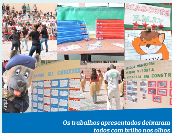
Os trabalhos apresentados deixaram todos com brilho nos olhos

O momento mais esperado da festa foi a apresentação dos cães da Guarda Municipal de Belo Horizonte. A apresentação foi dividida em duas etapas: a primeira parte foi estrelada por Akira, uma cadela da raça Pastor Alemão, que mostrou toda sua disciplina ao realizar um percurso cheio de obstáculos. Num segundo momento, toda a comunidade pôde chegar pertinho dos animais para tirar fotos e fazer carinho. Schumacher, da raça Border Collie , e Iudi, da raça Golden Retriever , fizeram a alegria de todos. A estrela do show, no entanto, foi Cachorroto, a mascote oficial da Guarda Municipal de Belo Horizonte. Ela conseguiu tirar sorrisos e gargalhadas de todos que estavam presentes com suas brincadeiras. No final da festa, enquanto fatias de bolo eram servidas, o grupo de Percussão de Sabará fechou a festa em grande estilo.