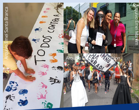
As Emeis Marfim e Santa Branca e a Emef Jardim Leblon foram algumas das unidades que desenvolveram campanhas contra o mosquito aedes aegypti

arredores da unidade com fantasias e cartazes que alertavam para a importância do combate ao mosquito. A equipe da Inova BH também tem feito sua parte, cuidando da limpeza interna e externa das unidades escolares para que o aedes aegypti não tenha chances nas nossas escolas!