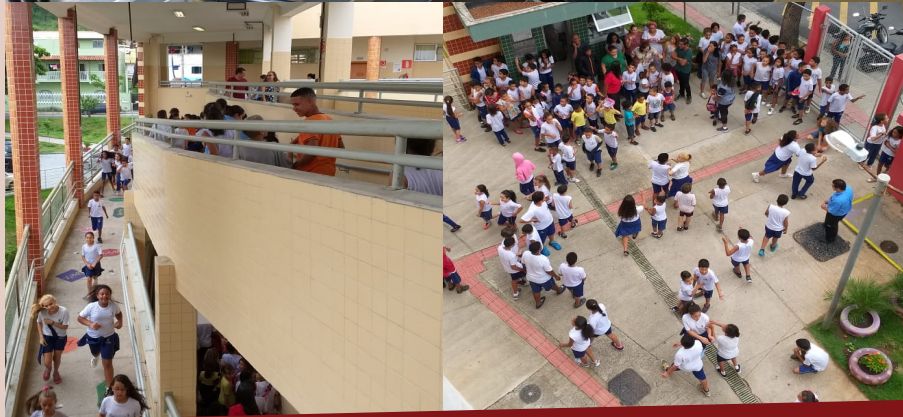
O treinamento de Brigada Contra Incêndio prepara a equipe para atuar em diversas situações