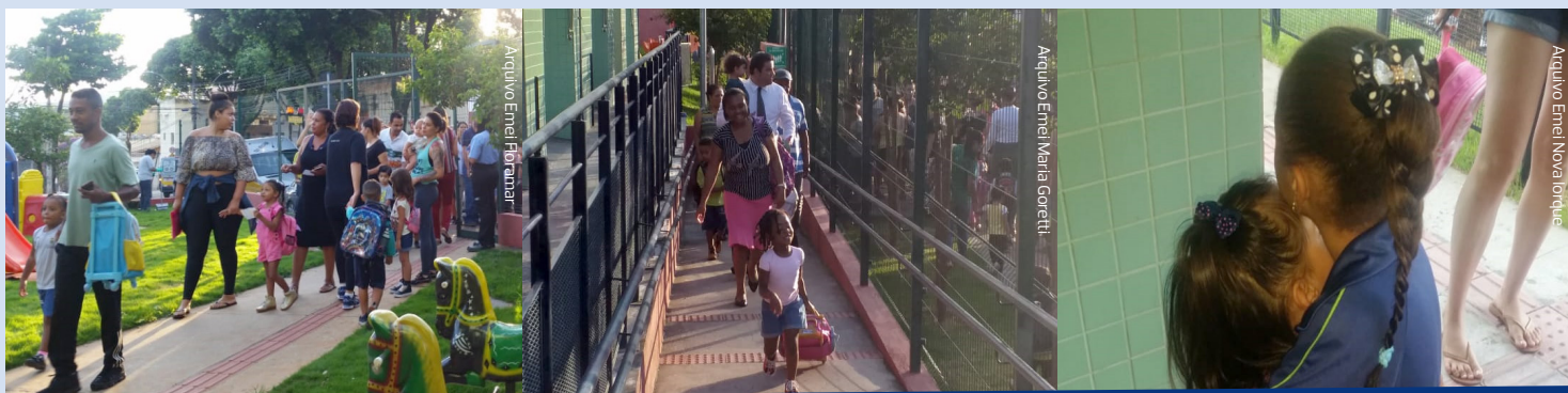
Pelas fotos já dá para perceber a empolgação das crianças no retorno às aulas!

criança entrou, a alegria ficou completa! Ver as crianças correndo para brincar no parquinho, para entrar nas salas e para abraçar os funcionários da escola nos enche de emoção. Nosso trabalho só ganha sentido com a presença de cada uma delas! Desejamos que, em 2019, as crianças possam aprender ainda mais!