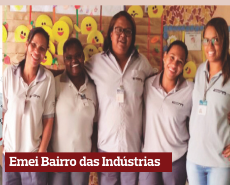
Emei Bairro das Indústrias