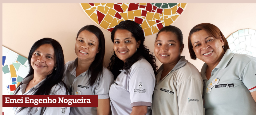
Emei Engenho Nogueira

Fora o ranking mensal, de janeiro a dezembro as notas obtidas por cada escola foram somadas e foi possível elaborar um ranking do ano. A disputa foi acirradíssima, pois a diferença de pontos entre as 51 escolas que fazem parte da parceria foi muito pequena. Todas as equipes possuem um alto pa-