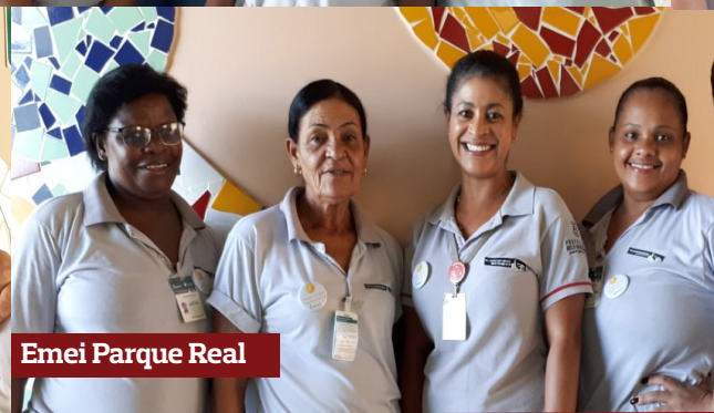
Emei Parque Real