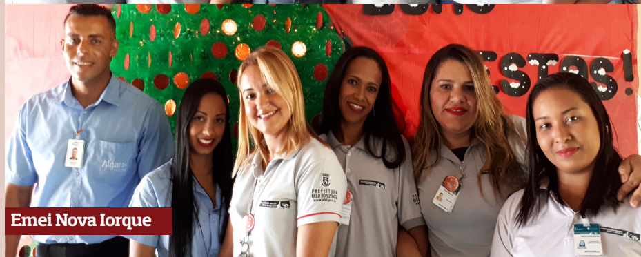
Emei Nova Iorque