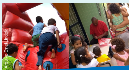
Com o tema Brinquedos e Brincadeiras, não faltou diversão na Mostra Cultural da Emei Lindeia