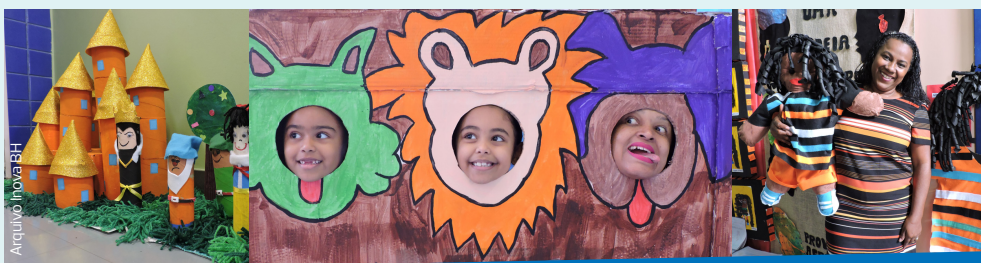
Na Emei Minaslândia era difícil saber quem estava mais orgulhoso com os trabalhos produzidos, se eram as crianças ou as professoras!