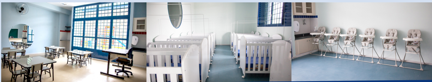
Conjunto de mesas e cadeiras, berços e cadeirinhas de alimentação são alguns dos móveis fornecidos pela Inova BH às escolas da Parceria

de cada item do mobiliário são definidas pela própria Prefeitura. O tamanho, o material, as cores, a espessura e as demais características dos móveis seguem os padrões estabelecidos em contrato. A Inova BH não pode modificar o tipo de mobiliário oferecido. Caso a escola ache necessária a alteração de algum dos itens, tal solicitação deve ser feita à PBH.