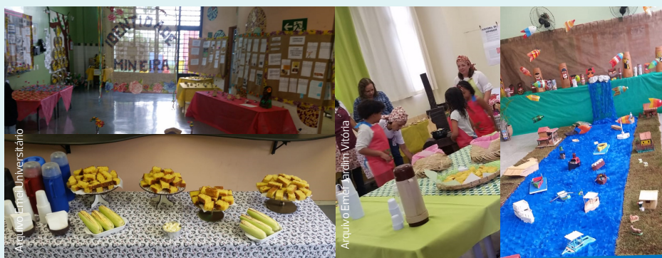
As escolas Universitário e Jardim Vitória abordaram a identidade e a cultura mineira, e claro que não poderia faltar também a culinária de Minas!