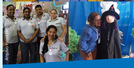
A Equipe da Inova BH também fica feliz em poder participar da organização das mostras culturais das escolas!