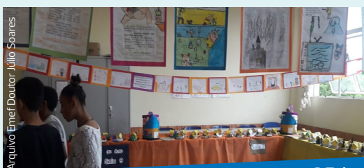
A Feira Literária na Emef Doutor Júlio Soares trouxe a todos a possibilidade de descobrir novas realidades por meio da literatura