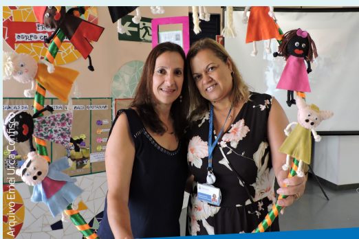
A diretora e a coordenadora da Emei Urca Confisco recebem as famílias ao lado dos personagens ícones da literatura infantil.

Diversas outras unidades também realizaram sua Mostra Cultural. Na Emei Urca Confisco o tema foi Apreciando a Literatura e na Escola Municipal de Ensino Fundamental (Emef) Doutor Júlio Soares foi realizada uma Feira Literária. Já na Emei Universitário, os trabalhos tratavam da Identidade Mineira. O assunto da Feira de Cultura da Emef Jardim Vitória também foi Minas Gerais e seus diversos aspectos, como os esportes, a culinária e o folclore.