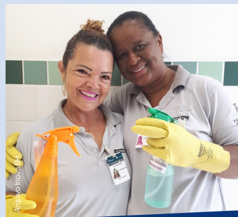
Auxiliares de Serviços Gerais e produtos de limpeza: uma dupla imbatível no combate à sujeira!

O trabalho conjunto dos produtos de limpeza e das Auxiliares de Serviços Gerais garante que o ambiente escolar esteja sempre adequado para o ensino e o aprendizado.