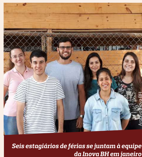
Seis estagiários de férias se juntam à equipe da Inova BH em janeiro

Além disso, o programa também dá oportunidade para que os alunos vivenciem o mercado de trabalho por meio do convívio e interação com os líderes da Inova BH. Os estagiários são todos da área de Engenharia Civil e estão atuando no setor de manutenção, acompanhando, verificando e participando de diversas atividades, como a de pintura. O programa tem sido um momento de bastante aprendizado para os estagiários e também para a Inova BH, em uma rica troca de conhecimentos. ■