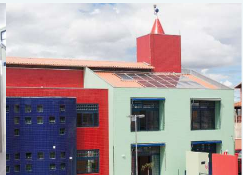
Coleta seletiva, torneiras com regulagem de vazão e aquecimento solar foram itens que contribuíram para a certificação no ISO 14001