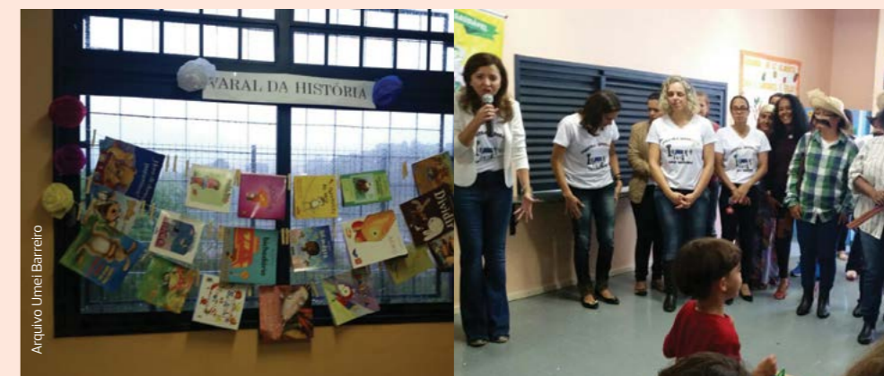
A Mostra literária e Festa da Família da Umei Barreiro levou todo mundo para o mundo dos livros e da imaginação