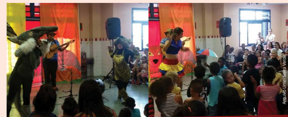
O que mais chamou atenção na Mostra Cultural da Umei Serra Verde foram as apresentações musicais e teatrais!

Também a Umei Parque Real realizou sua Mostra Cultural, que contou com a presença das crianças e seus familiares. Dos muitos projetos realizados, um deles foi o "Canta aí", que teve como objetivo ampliar o repertório musical da criançada a partir de expressões musicais como cantigas de roda e músicas infantis de várias infâncias. ■