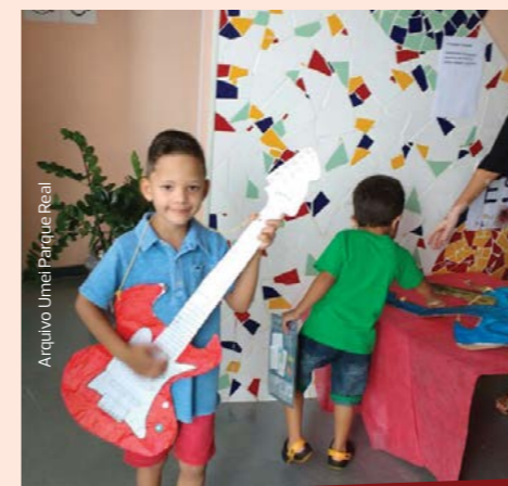
Um dos projetos que chamou a atenção de todos na Umei Parque Real foi o "Canta aí"