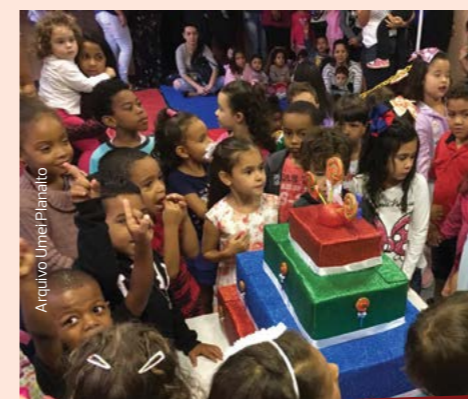
Na Umei Planalto a comemoração foi dupla: Mostra Cultural e aniversário de 3 anos da unidade