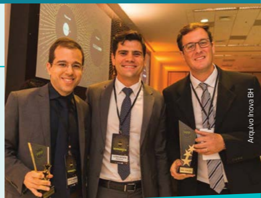
Alegria de saber que temos prestado um bom serviço à Educação de Belo Horizonte!