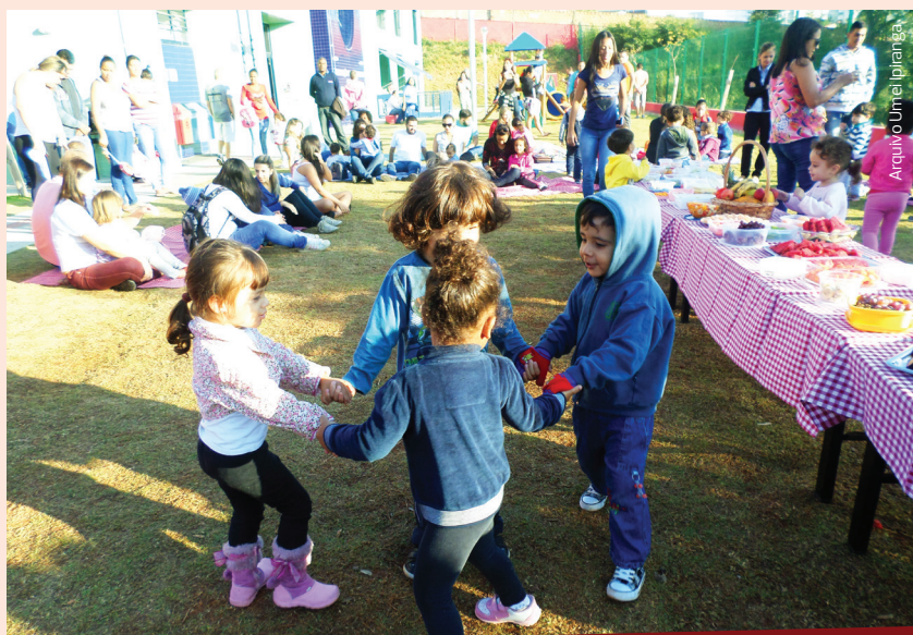
As crianças comeram, correram e brincaram muito!

O evento aconteceu nos dois turnos, no início da manhã e no final da tarde, para contemplar todas as turmas e famílias. Diversas frutas foram servidas, das mais tradicionais as mais peculiares. Não faltou kiwi, caqui, uva, melão, caju, manga, maçã... Um verdadeiro banquete! O encontro ainda contou com a participação do Grupo Griot, que divertiu e encantou crianças e adultos com estórias de origem africana. ■