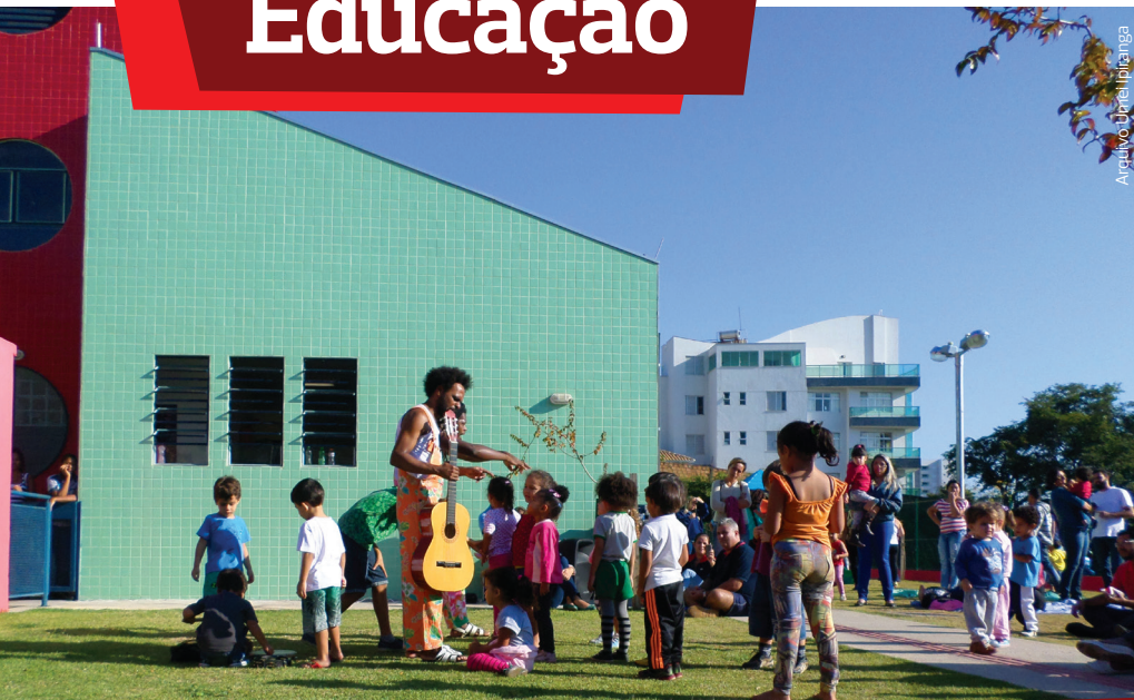
Grupo Griot se prepara para contar estórias de origem africana para as famílias