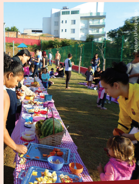
Vai uma frutinha aí?