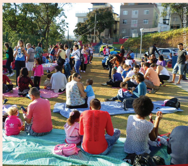
O encontro é também uma oportunidade para que as famílias conheçam de perto o espaço frequentado diariamente pelas crianças