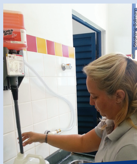
Uma das facilidades dos novos equipamentos é o dispensador de produtos químicos concentrados. Basta que a Auxiliar Administrativa encaixe o produto no equipamento para que a diluição seja feita. O próprio equipamento já mistura a quantidade adequada de água e o produto sai no galão pronto para o uso