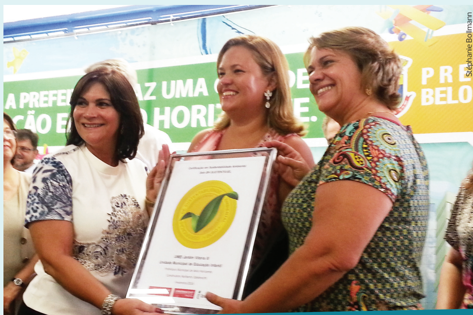
A Umei Jardim Vitória III recebe o Selo BH Sustentável, certificado que atesta os empreendimentos com mecanismos de redução no consumo de água, energia e resíduos

A Emef Jardim Vitória, assim como as demais Emefs da PPP, possui salas de aula, laboratórios de informática, biblioteca, refeitório, auditório e ginásio em 4.500m 2 construídos. Já a Umei Jardim Vitória III, assim como todas as Umeis da PPP, possui salas de aula, berçário, fraldário, refeitório, dentre outros espaços, em 1.100m 2 construídos. ■