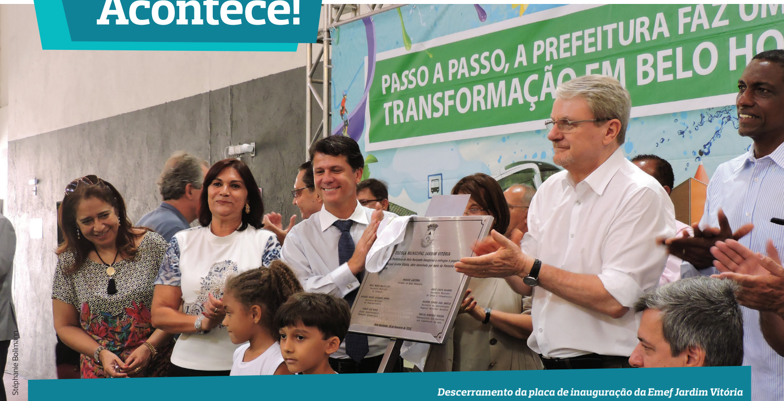
Descerramento da placa de inauguração da Emef Jardim Vitória