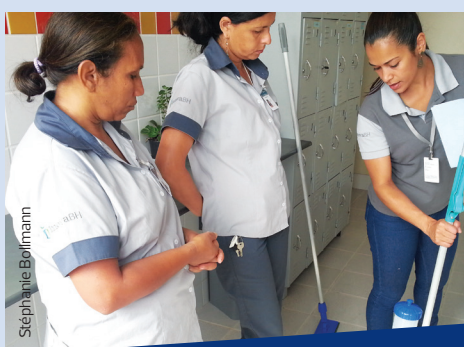
As Auxiliares de Serviços Gerais da Umei Planalto escutam atentamente as instruções de utilização do novo equipamento antes de partir para a prática