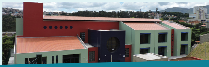
As 4 últimas unidades a serem entregues até o dia 17 de dezembro, fechando 51 unidades construídas em apenas 3 anos