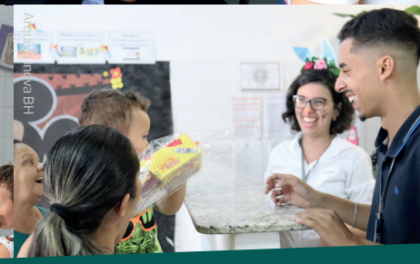
A tarde voluntária foi um sucesso e levou alegria e diversão para mais de 100 crianças apoiadas pelo projeto ASPAC