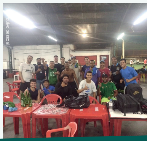
Semanalmente a equipe da Inova BH se reúne para a prática de exercícios físicos em cuidado com o corpo e a mente