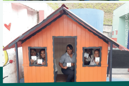
A Páscoa também foi comemorada nas escolas da Parceria