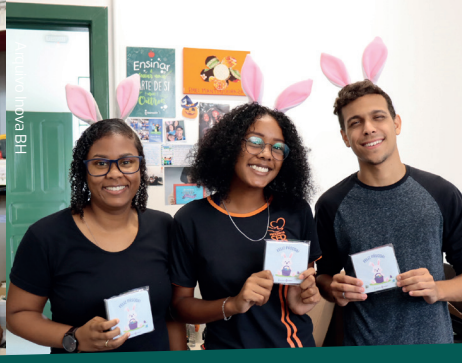
Todos os integrantes da Inova BH receberam chocolates para adoçar a Páscoa