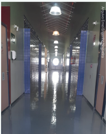
Arquivo Emei Engenho Nogueira

Cuidamos das escolas com muito carinho para que as crianças tenham um ambiente adequado para poder soltar a imaginação