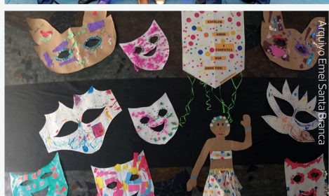
Arquivo Emef Santa Branca