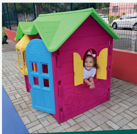
Arquivo Emei Sarandi

Cuidamos das escolas com muito carinho para que as crianças tenham um ambiente adequado para poder soltar a imaginação