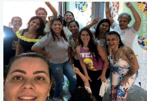
Arquivo Emef Santa Branca