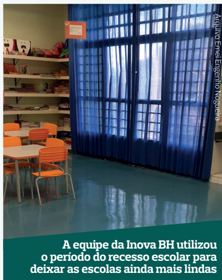
Arquivo Emei Engenho Nogueira

A equipe da Inova BH utilizou o período do recesso escolar para deixar as escolas ainda mais lindas