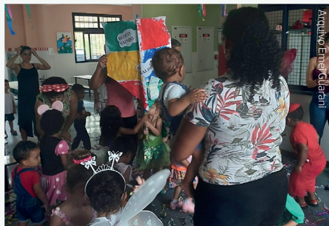
Arquivo Emef Cláudia