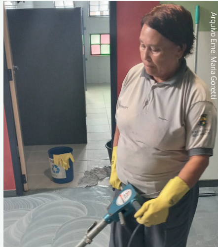
Arquivo Emel Maria Goretti