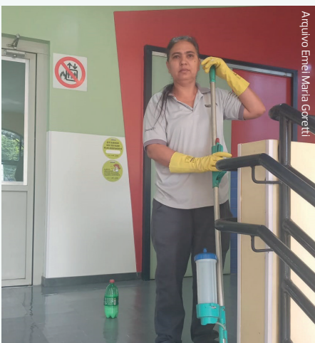
Arquivo Emel Maria Goretti