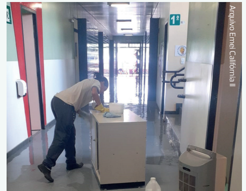
Arquivo Emel Callfornia II