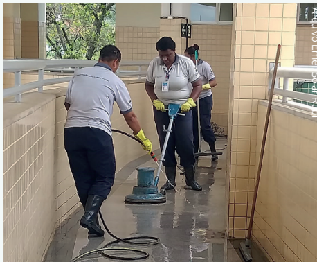
Arquivo Emel Saad-Rahdi