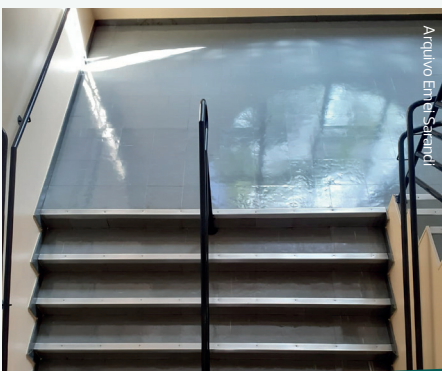
Arquivo Emel Maria Goretti