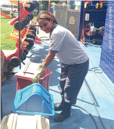
Arquivo Emel Maria Goretti