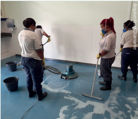
Arquivo Emel Diamante