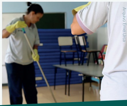
Arquivo Emel Maria Goretti

As equipes de limpeza e de manutenção da Inova BH levam amor e dedicação em todos os detalhes para receber os professores e as crianças