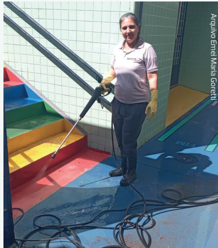
Arquivo Emel Maria Goretti