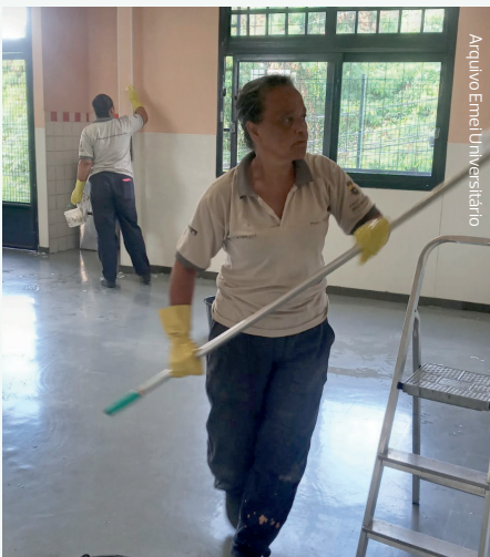
Arquivo Emel Maria Goretti