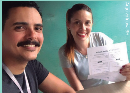
Alinhamento do Processo da Linha D'água com a equipe de Suprimentos

Também começamos a utilizar novas ferramentas no dia a dia, como o Princípio da Linha D'água. Com essa ferramenta em mãos, foi possível alinhar prioridades e delimitar a autonomia de cada colaborador para que todos pudessem gerenciar melhor o tempo gasto nas atividades. O alinhamento reforçou a responsabilidade de cada um perante os demais setores e a influência que o trabalho bem-feito exerce em outras áreas.