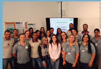
O time de Serviços criou um momento para disseminar o desafio da empresa