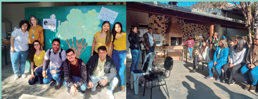
Campanhas internas alinhadas com os valores e propósito

E quem pensa que só aconteceram mudanças para os times do escritório, está enganado. Na foto ao lado você confere a equipe da Escola Municipal de Educação Infantil (Emei) Itaipu aprendendo uma outra ferramenta que foi muito utilizada em 2022: a Conversa de Valor. Essa ferramenta permite que as conversas sejam verdadeiras, assertivas, literais, objetivas e respeitadas. É uma forma de promover o diálogo saudável.