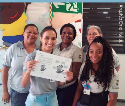
Apresentação da ferramenta Conversa de Valor para a equipe da Emei Itaipu

E quem pensa que só aconteceram mudanças para os times do escritório, está enganado. Na foto ao lado você confere a equipe da Escola Municipal de Educação Infantil (Emei) Itaipu aprendendo uma outra ferramenta que foi muito utilizada em 2022: a Conversa de Valor. Essa ferramenta permite que as conversas sejam verdadeiras, assertivas, literais, objetivas e respeitadas. É uma forma de promover o diálogo saudável.