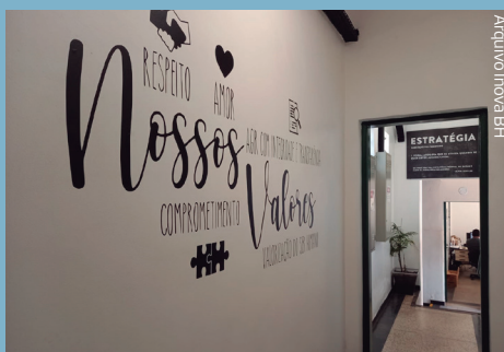
Parede estampada com os valores no escritório da Inova BH

Outra forma que a Inova BH utilizou para instigar o diálogo e promover discussões saudáveis foi a assinatura do Código de Ética nas Relações. Esta ação teve o objetivo de mostrar para a equipe a importância do alinhamento dos integrantes da Inova BH com os valores e a ética dentro das relações.