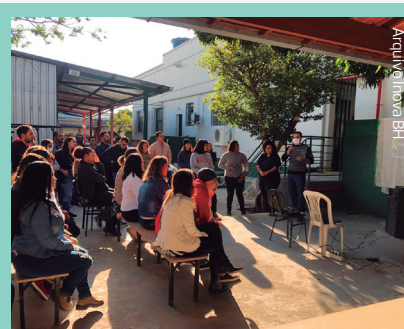
O DSSGI aborda temas de segurança do trabalho à cultura da empresa

O DSS (Diálogo Semanal de Segurança) foi repaginado e se transformou no DSSGI (Diálogo Semanal do Sistema de Gestão Integrada). Além de abordar assuntos pertinentes à equipe volante da Inova BH, o momento abriu portas para temas de segurança do trabalho, saúde, qualidade e cultura da empresa. O convite também foi estendido para os demais setores da empresa que possam ter interesse em debater assuntos relevantes para todos.