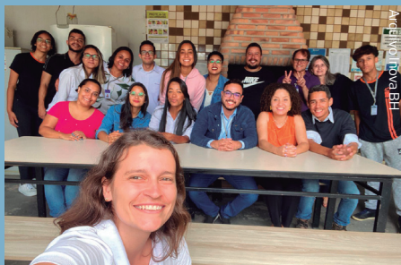
Equipe de SGI se reuniu para falar sobre a importância de escutar o outro

O primeiro passo para que a mudança pudesse ocorrer foi a criação de momentos para tratar das nossas relações, compartilhando e disseminando os diversos aprendizados, ferramentas e metodologias da Nova Economia.