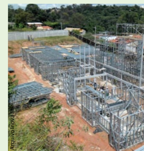
Em alguns meses as escolas ficam prontas para receber os alunos: Infraestrutura de qualidade para lecionar e aprender