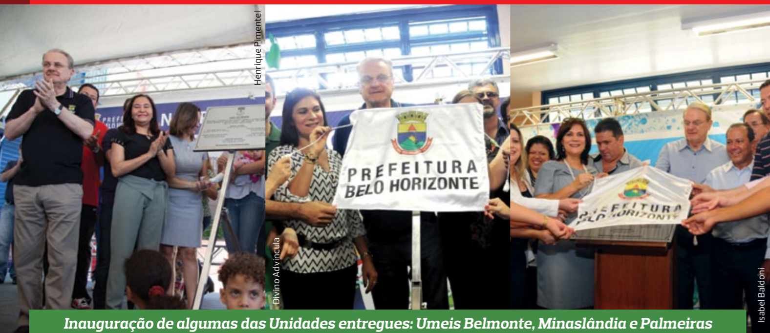
Inauguração de algumas das Unidades entregues: Umeis Belmonte, Minaslândia e Palmeiras