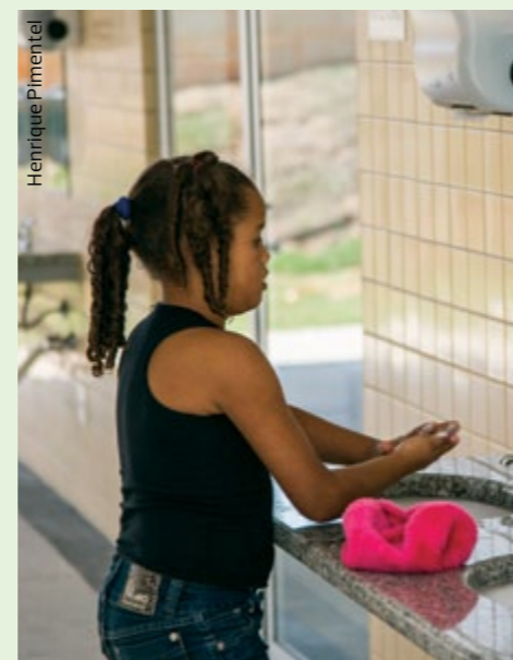
Ao todo já temos 14 escolas entregues, muitas delas já recebendo crianças, como as Umeis Minaslândia e São João Batista e a Emef Solar Rubi